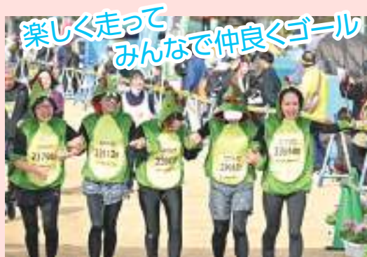
楽しく走って みんなで仲良くゴール