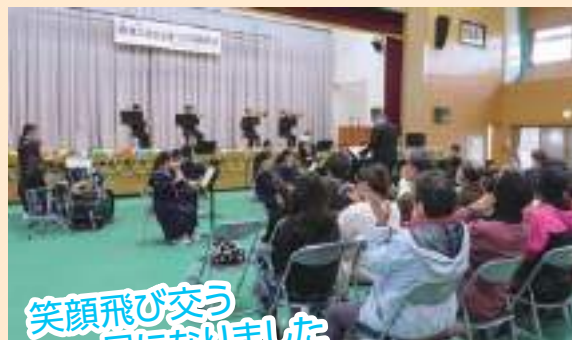
笑顔飛び交う 一日になりました