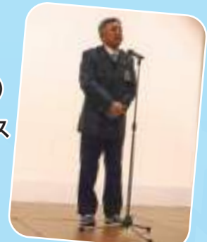
市長より花束 おめでとうございます