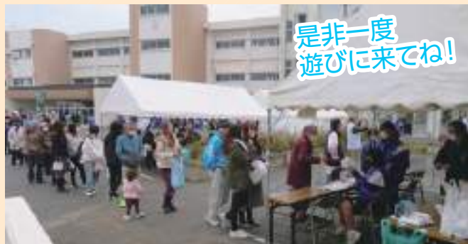
是非一度 遊びに来てね!