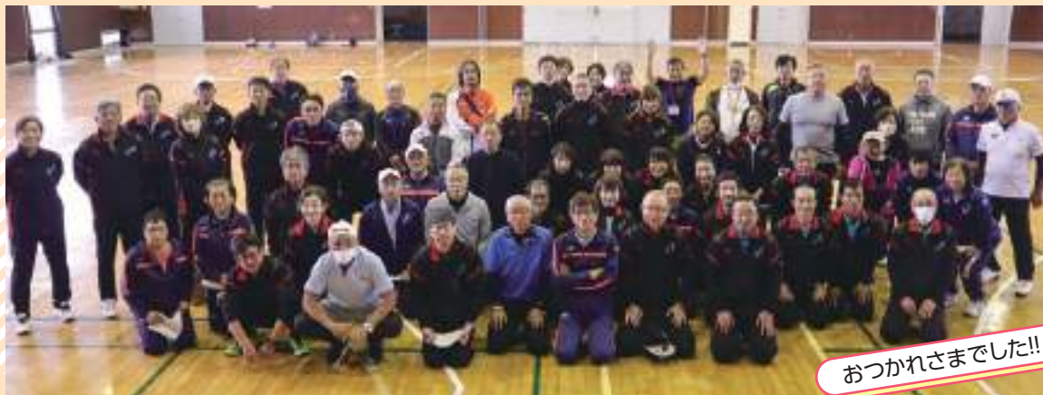
おつかれさまでした!!