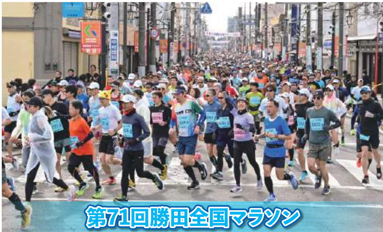
第71回勝田全国マラソン