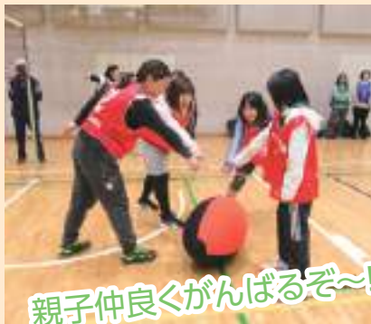
親子仲良くがんばるぞ〜!