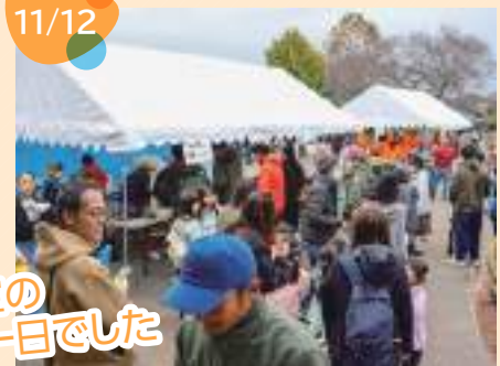
曇り空の寒い一日でした