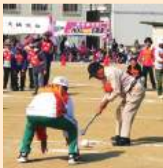
ご先輩方も 楽しく参加して います