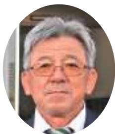
スポーツ推進委員長