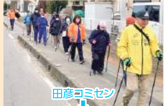
田彦コミセン ↓ 大島公園