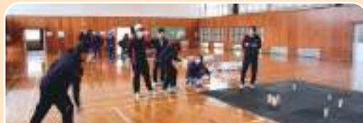
何点に なったかな?