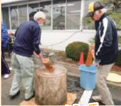
老体にムチをうって餅ついてます(笑)