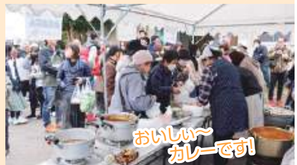
おいしい~カレーです!