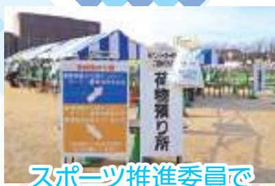
スポーツ推進委員で 管理・運営