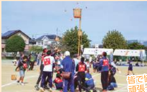
皆で協力して 頑張ってます