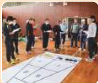
マイナス点に注意して!!