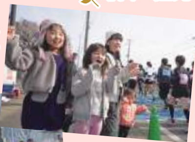
かわいい声援 頑張って♡