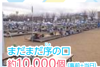
まだまだ序の口 約10,000個(事前+当日) お預かりしました