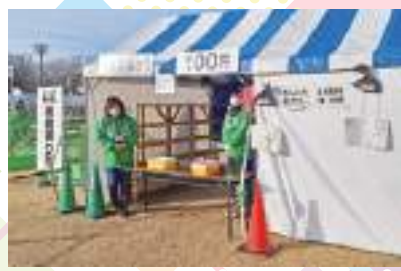
預けて安心 ✨ 貴重品 ✨