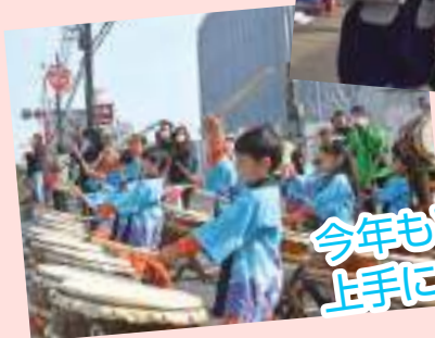
今年も平磯保育園 上手にたたいて応援!!