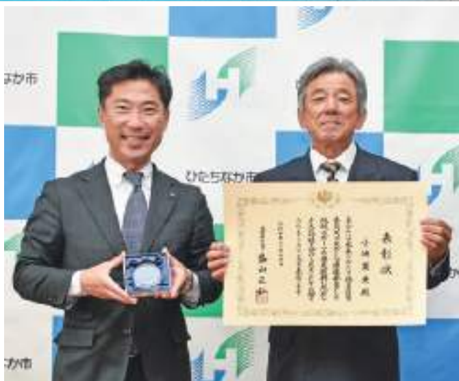
全国スポーツ推進委員 研究協議会青森大会