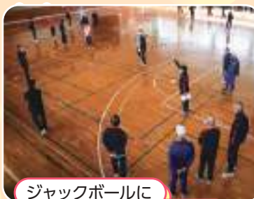
ジャックボールに 近いチームが勝ち