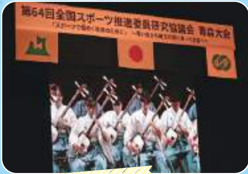
津軽三味線の演奏で 全国大会がはじまりました。