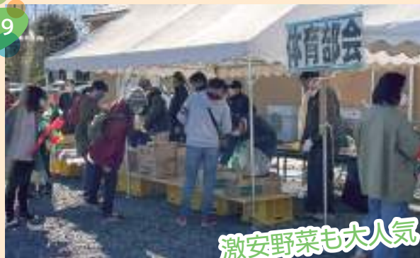
激安野菜も大人気